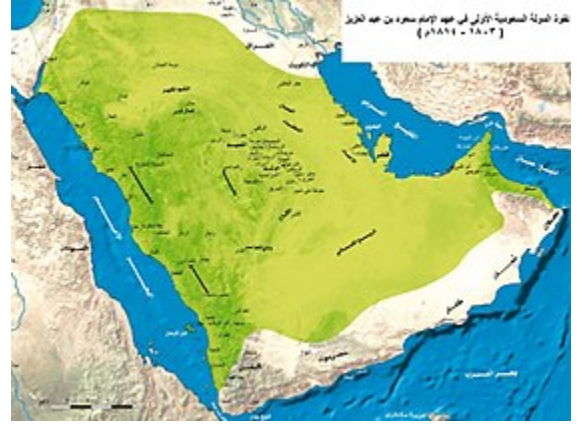
الدولة السعودية الأولى.